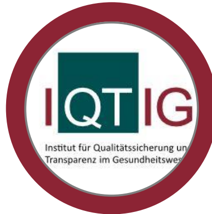
Meth. Grundlagen: Patientenzentrierung