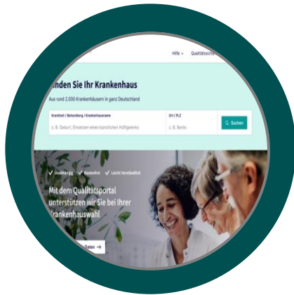
Konzept G-BA Qualitätsportal